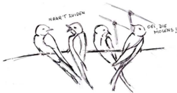
Tekening: Yvonne Kuypers